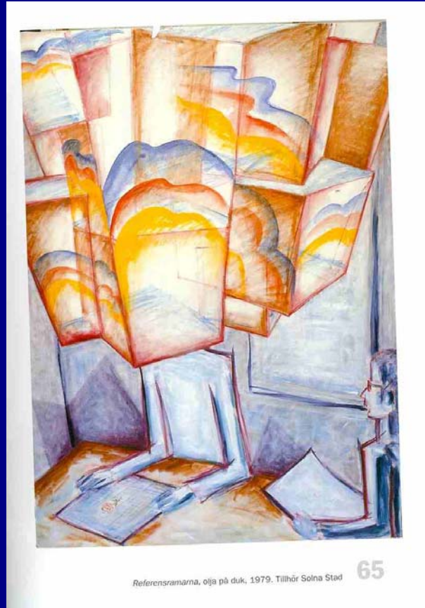
Referensramarna, olja på duk, 1979. Tillhör Solna Stad